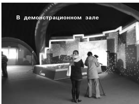
В демонстрационном зале

бережья Камчатки по воде двигались суда.