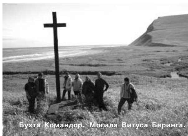
Бухта Командор. Могила Витуса Беринга.