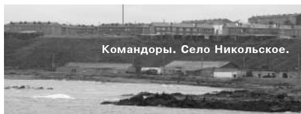
Командоры. Село Никольское.