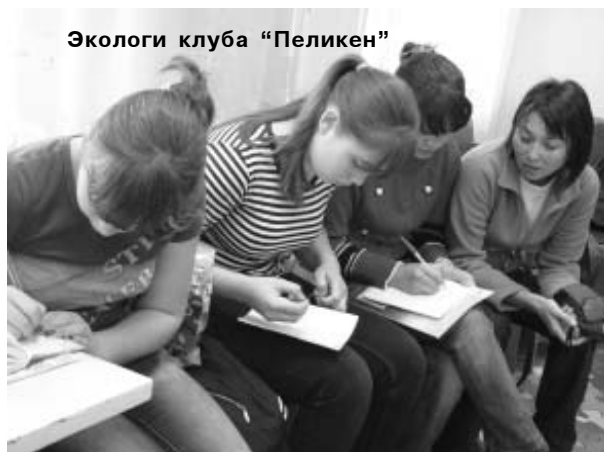
Экологи клуба "Пеликен"