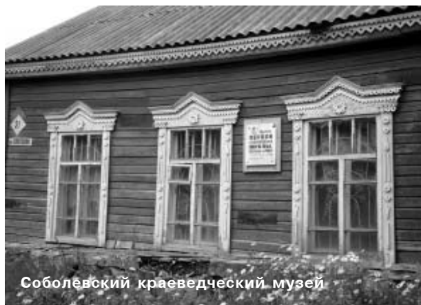
Соболевский краеведческий музей

В конце сентября в селе Соболево Камчатского края прошел семинар "Участие местных сообществ в обсуждении экологически значимых проектов". Тренинг стал частью проекта WWF и Европейского союза, направленного на усиление правоспособности жителей Камчатки в отношении благоприятной окружающей среды и традиционного образа жизни.