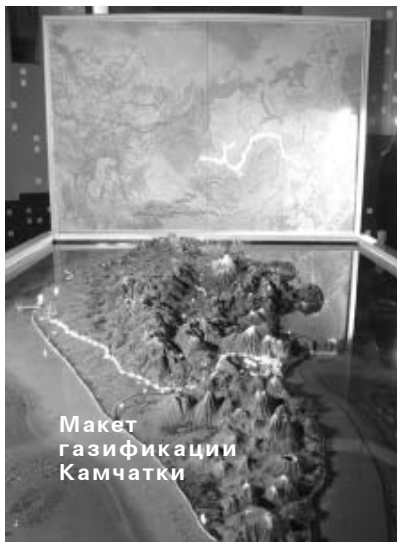
Макет газификации Камчатки

С 22 по 30 октября в Камчатском крае проходила региональная инвестиционная выставка “Камчатка сегодня, завтра. Традиция побеждать”.